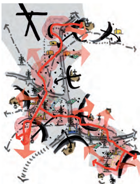
Évolution du Glattal esquisse Rainer Klostermann