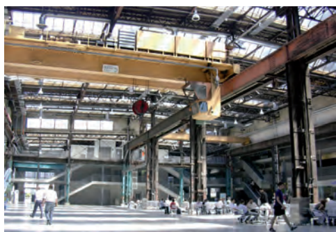
Puls 5 et la Giessereihalle

16h30 S-Bahn pour Zurich-West, quartier industriel en mutation depuis 1998. Visite de Zurich-West, au choix: Turbinenplatz (ADR Genève), Puls 5 et Giessereihalle (Kyncl Gasche Partner), Schiffbau (Ortner & Ortner Baukunst), arches du viaduc ferroviaire (EM2N), quartiers d'habitation Steinfels (Kaufmann, van der Meer & Partner), Schöller-Limmatwest (Kuhn Fischer Partner), Löwenbräu-Areal (Gigon/Guyer et atelier ww), Toni-Areal, fabrique de produits laitiers transformée en Zürcher Hochschule der Künste (EM2N), etc.