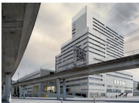
Toni-Areal transformé en Haute École des Arts

15h30 Bus de Riedbach à Oerlikon et visite de son espace public le plus éloquent, le MFO Park (Raderschall / Burckhardt+Partner), stratégie de reconversion d'une des plus grandes friches industrielles de Suisse par la construction préalable de 4 grands parcs publics.