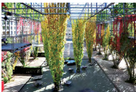
MFO Park NeuOerlikon

14h30 Visite du quartier "Mehr als Wohnen" (coopérative) en présence de Raphael Frei, architecte (pool Architekten).