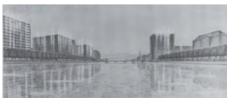
Projet de reconstruction du centre ville, Karl Moser 1933