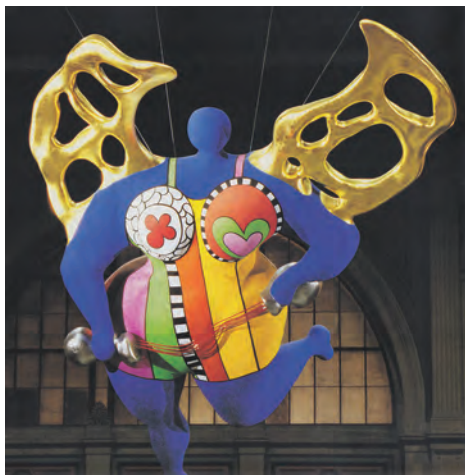
Ange protecteur, Niki de Saint Phalle 1997