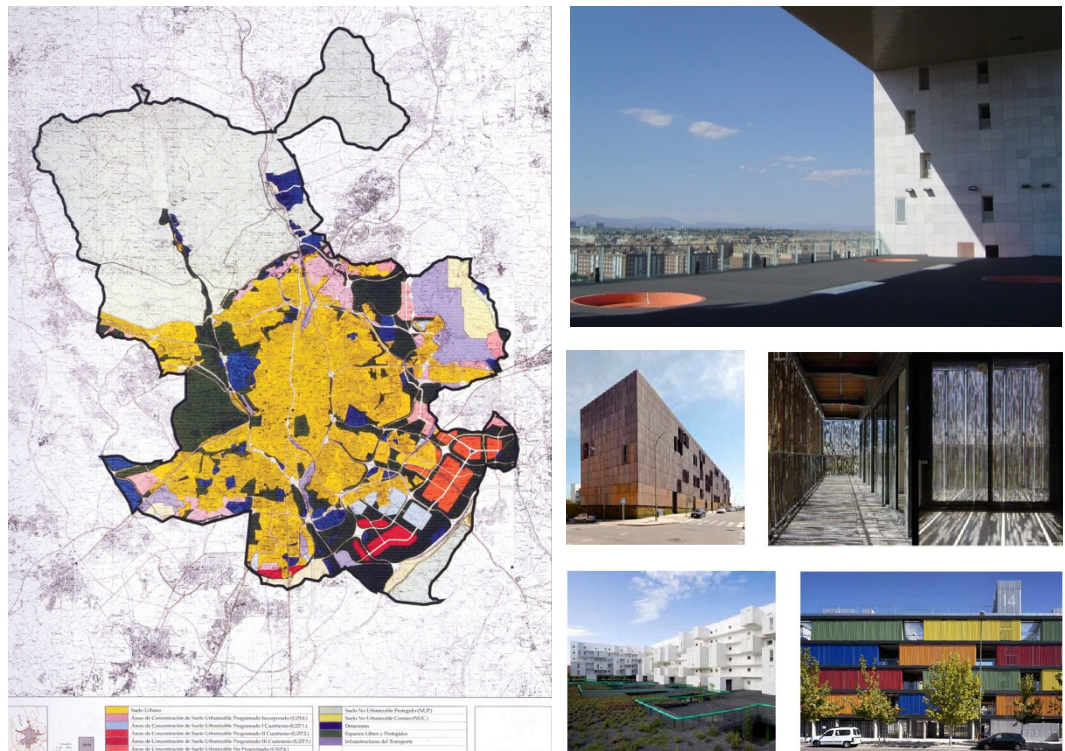
C) Situación de las parcelas con licencia de Nueva Edificación

17:00 Visite extérieure des Logements sociaux, MVRDV et Carmen Lleó, 2004 dans le quartier de San Chinarro. Suite de la promenade par la M 30 en direction des extensions urbaines au sud de la ville.